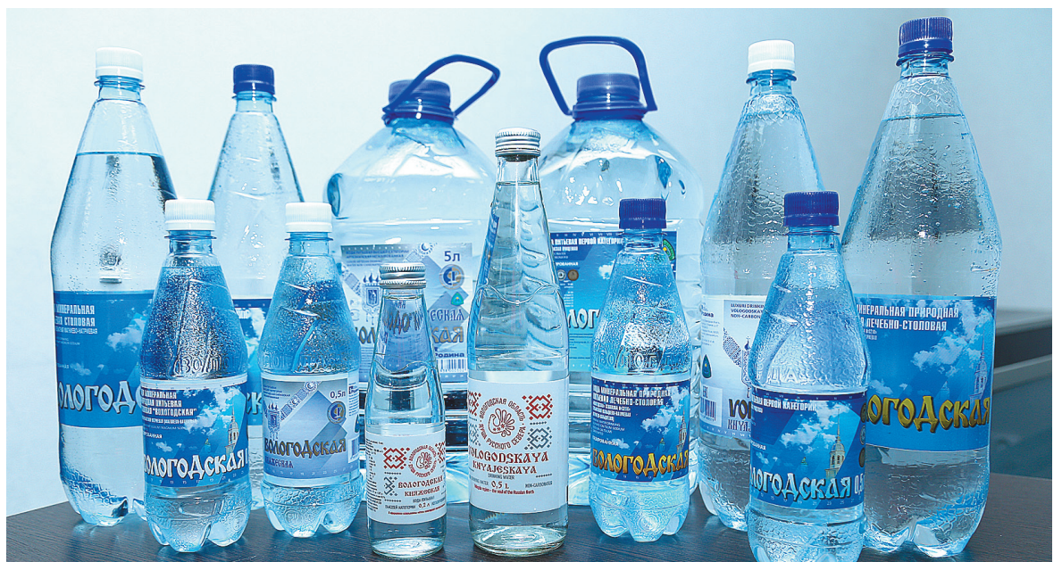
Пейте «Вологодскую» воду сколько угодно!

Добиться таких результатов было непросто: в цехе внедрена дорогая многоступенчатая система очистки с помощью специальных фильтров, через которые вода проходит медленно, по определенной технологической схеме. Это очень дорогостоящий процесс. В отличие от воды первой категории требования к составу «Княжеской» воды еще