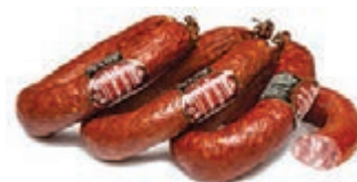
Колбаса полукопченая «Балыковая по-Туймазински»