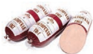
Колбаса вареная «Докторская»

На мясокомбинате «САВА» стремятся к тому, чтобы колбаса каждого наименования соответствовала единому стандарту качества – по вкусу, консистенции, цвету. Ступени профессионального роста отражают многочисленные награды выставок республиканского и российского уровня, в том числе Всероссийской агропромышленной выставки «Золотая осень», в которой предприятие участвует с 2005 года. Разные виды колбасных изделий не раз попадали в число «Лучших товаров Башкортостана» и «100 лучших товаров России». В 2014 году лауреатами в конкурсе «Лучшие товары Башкортостана» стали четыре вида продукции: вареные колбасы «Докторская» и «Туймазинская», колбаса полукопченая «Балыковая по-Туймазински» и сосиски «Молочные».