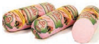
Колбаса вареная «Туймазинская»