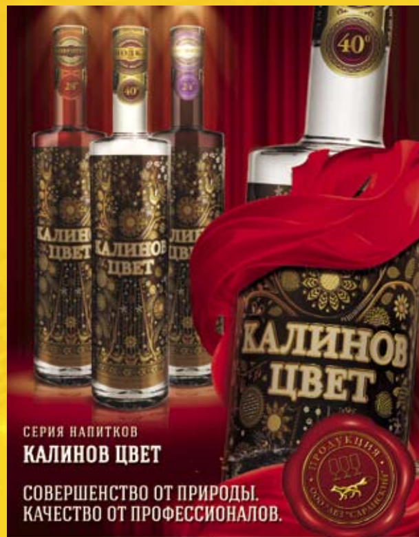
СЕРИЯ НАПИТКОВ КАЛИНОВ ЦВЕТ

СОВЕРШЕНСТВО ОТ ПРИРОДЫ. КАЧЕСТВО ОТ ПРОФЕССИОНАЛОВ.