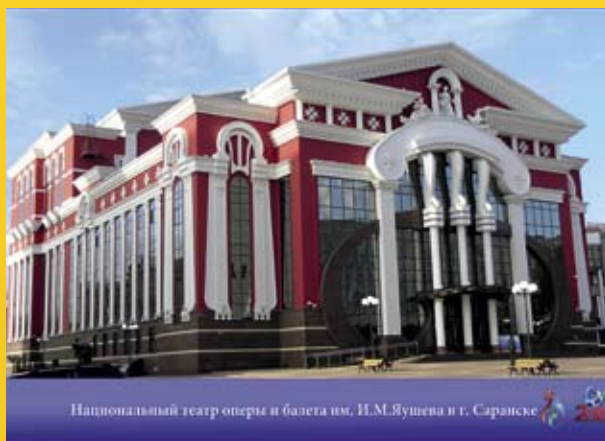
Национальный театр оперы и балета им. И.М.Яушева в г. Саранске

Институт высококачественно осуществляет комплекс работ по инженерным изысканиям и подготовке проектной документации, обеспечивающих безопасность и комфортность объектов капитального строительства. Среди новых проектов института - здания Национального театра оперы и балета им. И.М. Яушева, Центра ассоциации финно-угорских народов Российской Федерации; межрегиональный центр для одаренных детей в г. Саранске, административное здание Мордовиястат в г. Саранске, жилые дома для ОАО «Мордовская ипотечная корпорация», лыжно-биатлонный центр в г.Саранске; диализные центры - в г.Саранске, г. Пензе, г. Белгороде; яйцеперерабатывающая фабрика «РузОво» в г. Рузаевке; ледовые дворцы - в г. Рузаевке, п. Ромоданово, п. Комсомольский; стадионы - в г. Саранске, г. Инсаре, г. Краснослободске, г. Темникове, рп Зубово-Поляна. Проведены инженерные изыскания для строительства крупнейшего футбольного стадиона «Юбилейный» на 44 тыс. зрительских мест в г. Саранске, комплексной застройки многоэтажными домами жилых микрорайонов в районе реки Тавлы в г. Саранске, строительства Мордовского племенного центра в Ковылкинском районе Республики Мордовия, установки паточных баков ёмкостью по 10 тыс. куб. метров Ромодановского сахарного завода и многих других объектов.