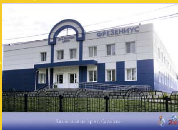
Диспансеризация центр в г. Саранске