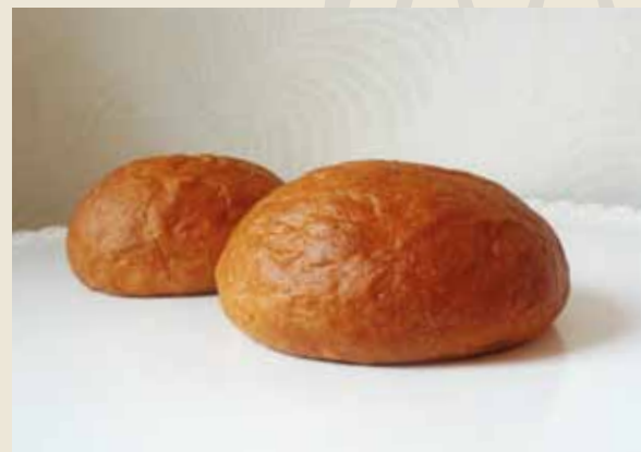
«Молочные булочки» с начинкой «Кремфил»