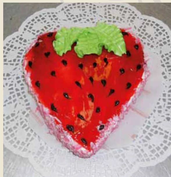
Торт бисквитный «Клубничка»