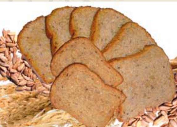
Хлеб диетический «Мультисид»