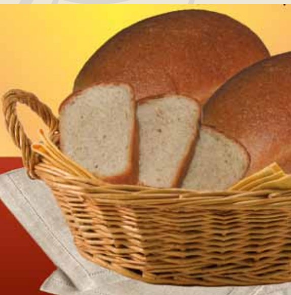
Хлебобулочное диетическое изделие «Вита» с ячменной мукой