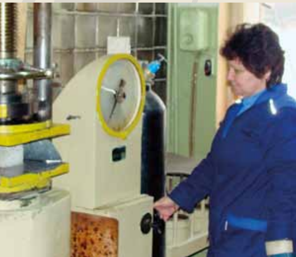
Определение прочности бетона