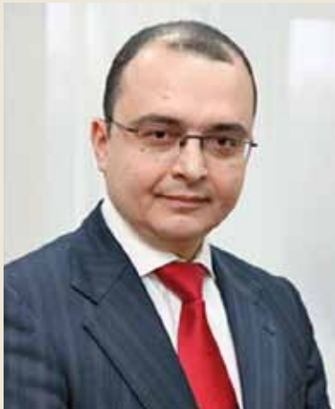
Антон Фридман, министр экономического развития Республики Коми