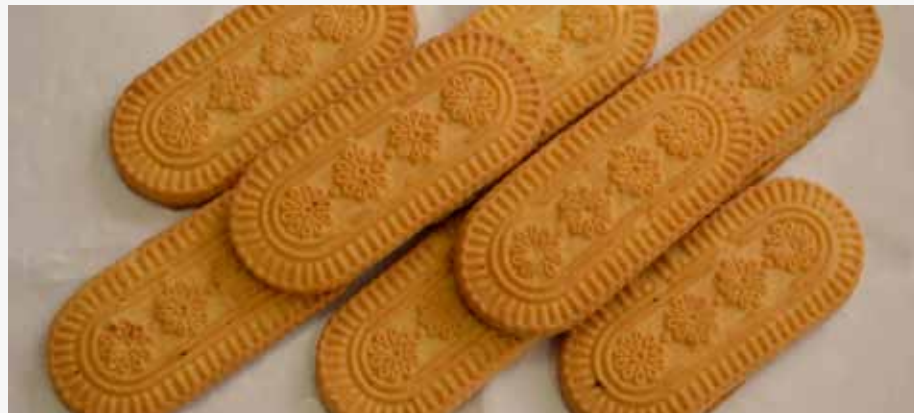
Печенье сахарное «К Юбилею»