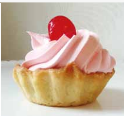
Песочное пирожное корзиночка «Оригинальная»