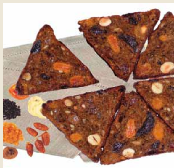
Хлебобулочное изделие «Совитал Фруктовый»

Адрес: 167983, Республика Коми, г. Сыктывкар, ул. Громова, д. 83. Тел./факс: (8212) 222-828, 222-559, 222-939. E-mail: syktyvkar_hleb@mail.ru