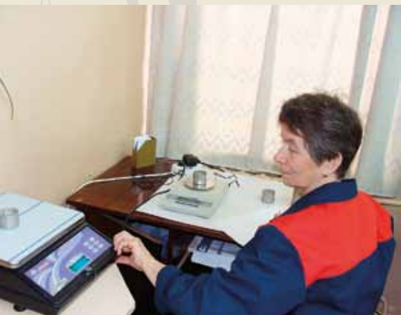
Определение коэффициента уплотнения песчаного основания

Строительные, коммунальные, бытовые услуги