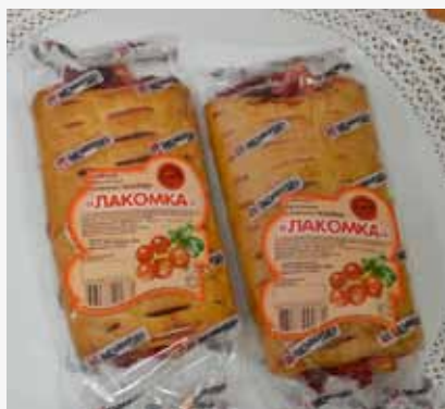
Булочные слоеные изделия «Каприз»-«Лакомка» с брусникой